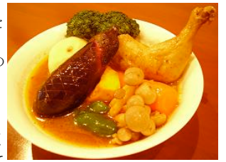
平直はとりもベジタブル、皿から溢れんばかりの具材が盛りだくさん。

やしなど数十種類の中から、メインとなる食材を選びます。次に辛さ。スープカレーはもともと辛い料理なので基本が辛口となります。辛いのが苦手な方に中辛を用意してありますが、スパイスをふんだんにスープに入れているため、どうしてもまったく辛くなくすることはできません。逆に辛いのが全然平気という方には天井知らずで、辛さを加えます。