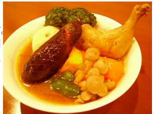
写真はとり&ベジタブル。皿から溢れんばかりの具材が盛りだくさん。

がりです。完全なレシピは公開できませんが、簡単に書くとこんな感じですが、特徴はオリジナルスパイス、調理、梱包まで完全手作業であること。あとは保存料や着色料など一切使用していないということで安心してお召し上がりいただけます。開封後は冷蔵保存していただき賞味期限が3週間となります。私の経験上、1日で一瓶空いてしまうこともしばしば。営業で余った