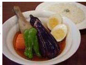
こんな感じの料理です。大きな具材がスープの中に沢山！

てほしいと思います。本場、北海道では庶民的な料理なので、皆さんいろいろな食べ方で食されていました。ラーメンを食べる様な感覚で気取らず、気軽に食べていました。 だから鳥肉なんかも両手で「がぶり」とかぶりついてよいですし、手が汚れるのが嫌な方は、フォークとナイフでほぐして、スープに浸して食べたりと、いろいろな食べ方があります。