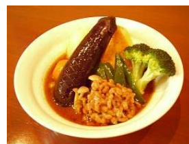
スープの中にあるのは、なんと「納豆」！でもこれが意外とおいしいんです。

という方法もあります。次にスープにスパイスを入れます。コリアンダーやクミン、ターメリックなど入れることによって、カレーの味がするようになります。元々、健康食を作ろうとして、スープに香辛料を入れたことがキッカケでスープカレーが生まれたので、スパイスを入れるのがポイントになります。ここまでできたら、あとはお皿に具材を盛り付け、そこにスープを注げば、完成となります。ライスと一緒に食べてください。食べ方は 前回ご案内したスプーンにライスを盛って、スープに浸して、食べる、でした。とまあ、ご家庭でもスープカレーは作れます。これから寒くなると、より一層恋しくなるスープカレー。まず一度食べてみましょう。