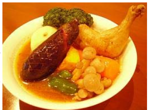
写真はとりやさいカレー。皿から溢れんばかりの具材が盛りだくさん。

いと思いますが、鶏がらやとんこつ、各種野菜等で時間もかけて作ったスープで食べると旨みとコクは全然違うと思います。スープを丁寧に作りあげスパイスをふんだんに使っている店のスープカレーは値段もそこそこしますが、それだけ手が込んでいると思います。逆に安いと思われるような値段のスープカレーでは、そこまで手が込んでいないのでは、と思えてしまいます。先に述べたように「これがスープカレーだ」という定義がないので、簡単に作れてしまうところも魅力のひとつです。また人それぞれ